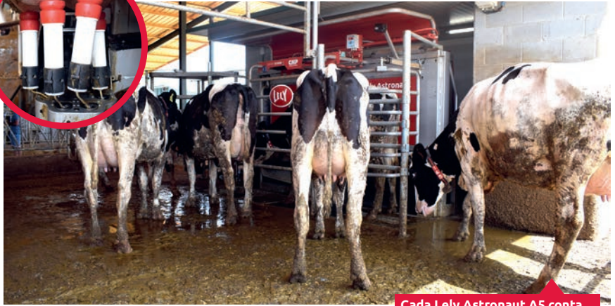
Cada Lely Astronaut A5 conta con báscula e con contador de células somáticas